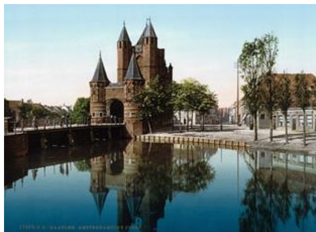
Een voorbeeld van een intacte barbacane in Nederland is de Amsterdamse Poort in Haarlem, hier rond 1900

Een barbacane, vooral in Engeland en Frankrijk voorkomend, is een versterkte voorpoort die integraal onderdeel uitmaakt van de verdedigingsstructuur van een kasteel. In Nederland zijn wel eens barbacanes gevonden bij verdedigingswerken rondom een stad, maar bij een kasteel waren ze tot dusver onbekend.