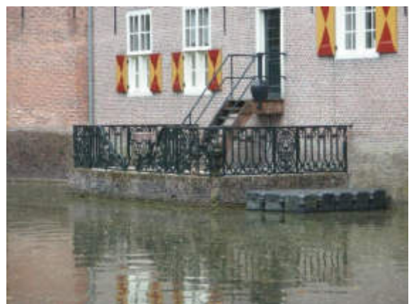
Het smeedijzeren hek.

Een eeuw na het graven van de vaart werd een monumentaal toegangshek geplaatst. Dat hek is nog steeds bijzonder fraai. De tuinvazen staan op het voorplein van het kasteel. Na de demping van de Reevaart omstreeks 1970 is het smeedijzeren hek van de steiger aan de achtergevel van het kasteel geplaatst.