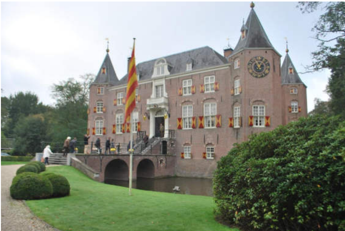
Kasteel Nederhorst tijdens de excursie van VKHZ op 22-10-2016.