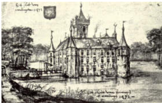
Het slot Honingen in welstand.

In de eerste column over de buitenplaatsen van Kralingen heb ik u geschreven dat langs de 's Gravenweg zich een interessant lint van buitenplaatsen heeft bevonden, waarvan er nog enkele over zijn. (1) Het mooiste stukje van Kralingen Oost is het Park Honingen: rond om twee schitterende vijvers bevinden zich fraaie 19 e eeuwse villa's. De geschiedenis van Kralingen en de 's Gravenweg is nauw verbonden met het Slot Honingen. Sinds de 13 e eeuw was het Slot gelegen tussen de 's Gravenweg en de rivier. De 's Gravenweg ligt er al vanaf de 12 e eeuw en is ouder dan het Slot. Het slot werd hier gebouwd op veengrond, hetgeen zoals Craandijk beschrijft de "zwaarte" van de fundamenten en de dikte der muren nadelig heeft beïnvloed. (2,6) Hij bedoelde hiermee te zeggen dat het niet leek op de fundamenten van een sterk kasteel. De vraag is echter of het wel de fundering van het slot was die hij daar aantrof. Het ontleende zijn sterkte aan de ligging midden in de zeer grote vijver, waarvan de resten het Park Honingen vandaag nog zo aantrekkelijk maken. Deze vijver, waal of wiel, geheten was waarschijnlijk het restant van een dijkdoorbraak. (2,3,4) van voor de bouw van het slot Honingen