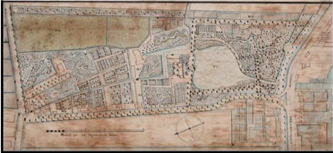
Huis Slot Honingen in 1818 op een kaart van J.Munro. Het huis ligt vrijwel midden in de plattegrond, met rechts en er boven de vijvers, er omheen de tuinen. Rechts bevindt zich de Hooghen Zeedijk (Nu Honingerdijk). Links is de 's Gravenweg, en onder loopt langs het landgoed de Hoflaan. (2,12)