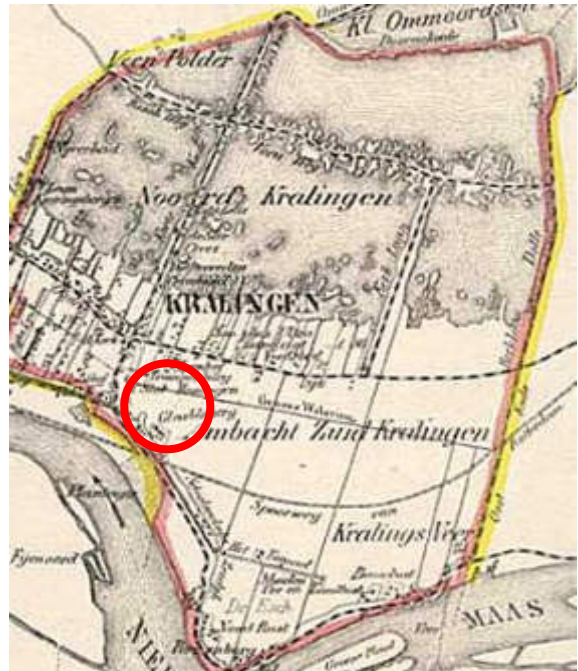
J. Kuijper kaart van Kralingen 1865, Suringar, Leeuwarden. De zwart-wit geblokte weg onder de plassen is de Oudedijk's Gravenweg. Met in rood een markering voor de locatie van Slot Honingen.

dat de familie zijn naam ontleent aan het dan al bestaande dorp, dat dan overigens wel op enige afstand ligt. Onbekend is wanneer de Cralinghe's zich hier voor het eerst gevestigd hebben.