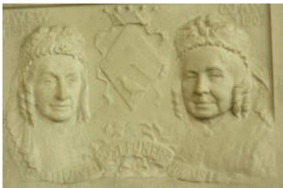
Plaquette van de freules Warin.

In de kerk zijn een aantal rouwborden te zien en een Bätz orgel, dat gefinancierd is door de freules Warin. De plaquette van deze twee dames is in de muur gemetseld.